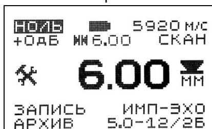
Вид экрана в режиме измерений толщины