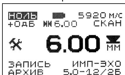
Вид экрана в режиме измерений толщины